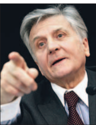
La BCE pourrait augmenter ses taux en juin, a dit en substance Trichet.

LES MARCHÉS monétaires n'estimaient plus hier soir qu'à 20 ou 30% la probabilité que la Banque centrale européenne (BCE) hausse ses taux lors de sa réunion du 4 mai. Quelques heures plus tôt, avant que son président, Jean-Claude Trichet, ne tienne sa traditionnelle conférence de presse d'après décision sur les taux, la probabilité était encore de quasi 100%. La BCE a, comme prévu, maintenu hier son taux directeur inchangé à 2,50%. Mais Trichet a dit ensuite que les marchés se trompaient s'ils tablaient sur une hausse en mai. Malgré les pressions inflationnistes et une