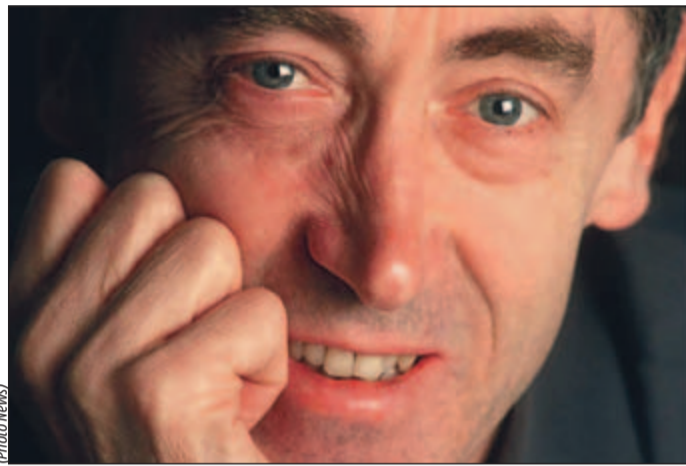
Paul De Grauwe doute des chances de succès du plan Marshall.